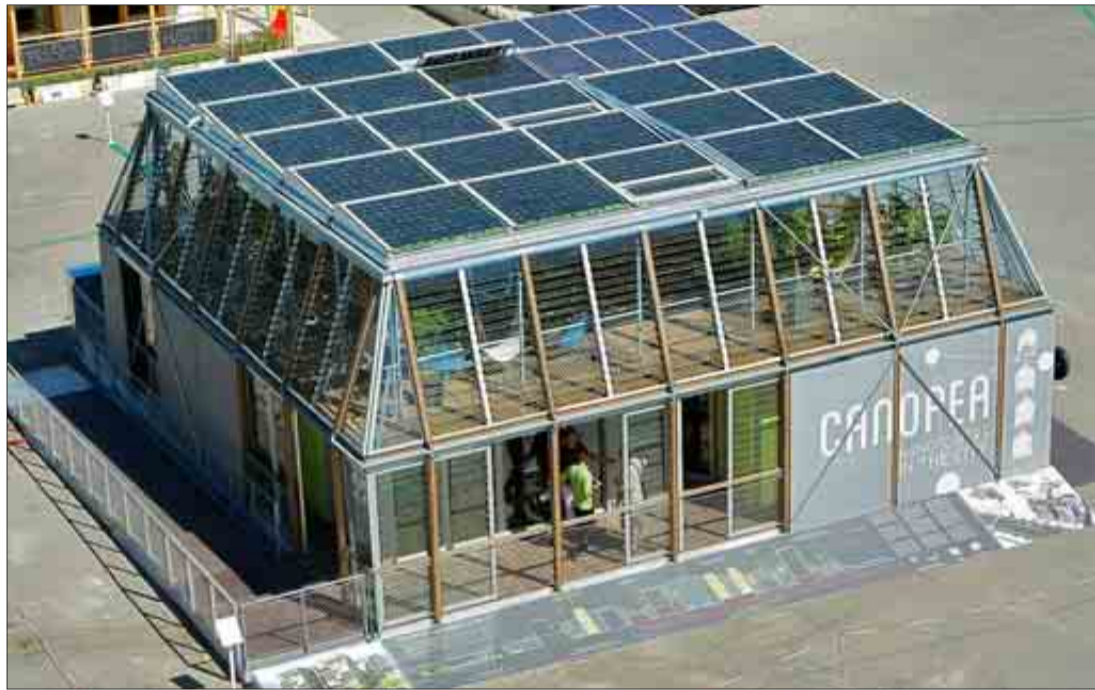
'Canopea', el prototipo de casa solar ganador del Solar Decathlon Europe 2012.

Esta vivienda, construida con materiales tradicionales –cerámica y madera–, propone una alternativa de espacio doméstico que consiste en añadir «pabellones» en torno a un espacio intermedio –el patio– y no necesita la división mediante tabiques.